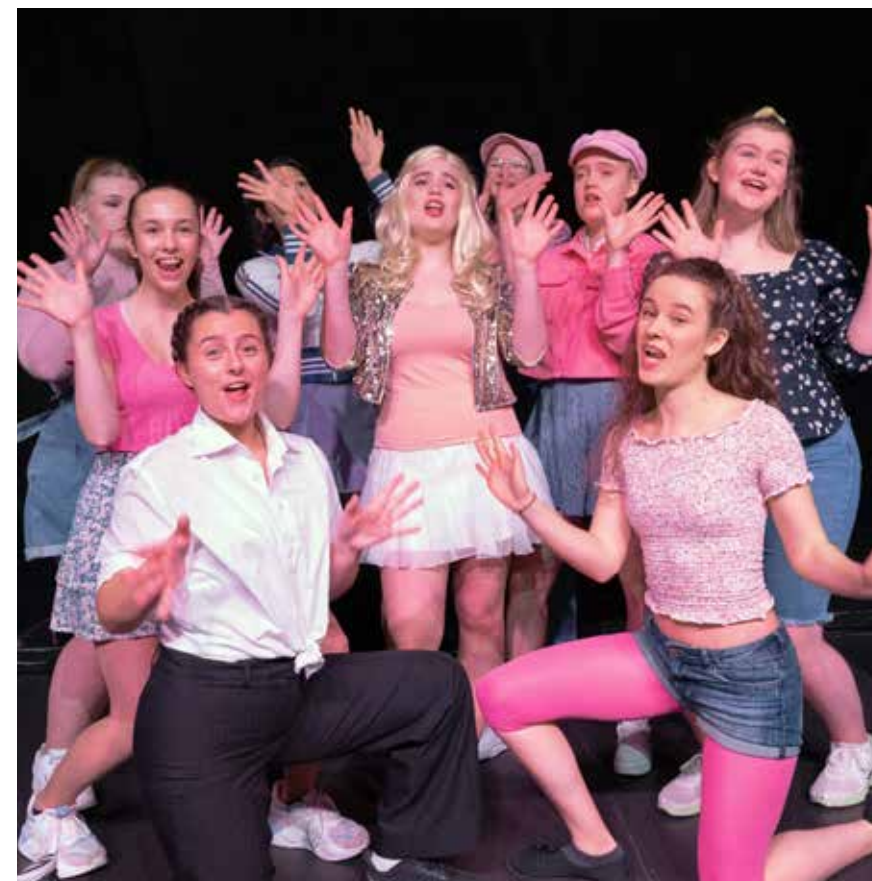
Hvert år setter skolen opp en musikal.