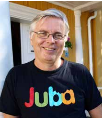
Å være leder for IOGTs barneorganisasjon, Juba, er et annet høydepunkt.

– Når en 10-åring løper etter meg på Haugerud for å fortelle meg at han skåra mål i siste fotballkamp, er det belønning for meg, det må jeg også skrive opp på den kontoen. Når du da lykkes med mye som idrettslag, får du etterhvert en ganske stor konto som du kan ta av når det butter imot. Da er du ikke avhengig av at du får priser fra Aftenposten, smiler Endal.