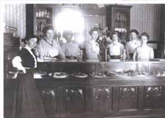
Selskapets medarbeidere i restaurantlokalet tidlig på nittenhundretallet