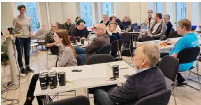
NGR sitt siste møte i IOGT-huset i Torggata.