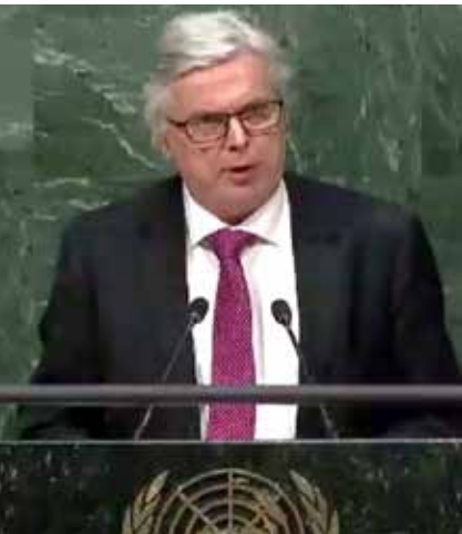
I 2018 fikk Endal også stå på FNs talerstol for å snakke om forebyggingsarbeid.

– Vi brukte et par dager i en chat-gruppe – det ble en folkelig mobilisering. Vi fikk samlet inn 73 000 kroner til